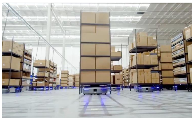
株式会社フジテックス：株式会社ギークプラス 「自動搬送ロボット：EVE」

当社は、SG ホールディングスグループがこの物流センターを核として推進する「X（エックス）フロンティアプロジェクト」において、物流倉庫用の各種設備やシステム、スペースを複数の EC 事業者で共同利用できる「シェアリング・フルフィルメントサービス」を展開します。多額の設備投資を要する最新の設備・システムを複数の事業者で共有することで、より少ない費用負担で EC ビジネスを展開できる利点があります。