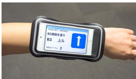
腕に付けている作業者端末へ経路指示